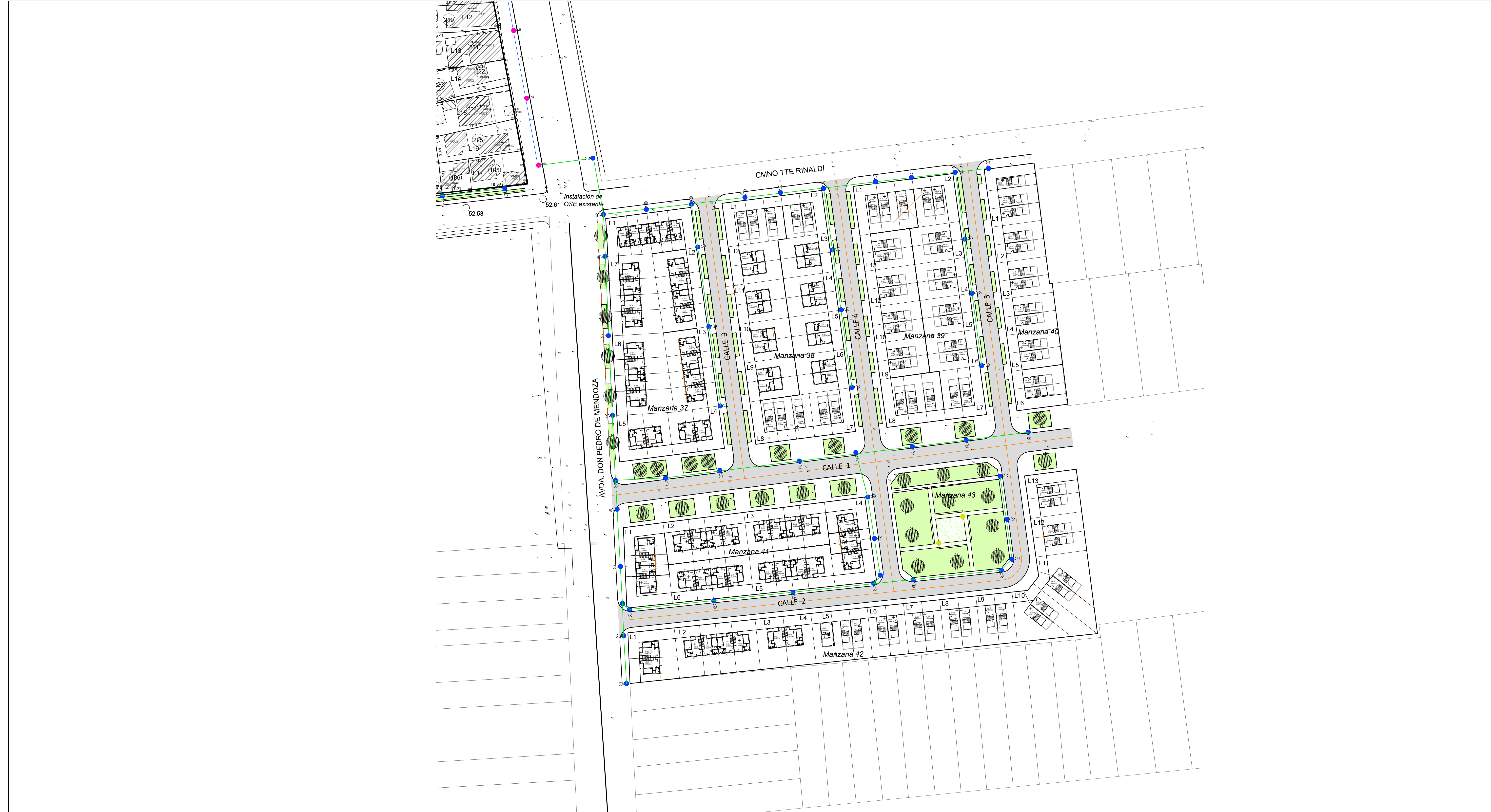
LOTES PARA REALOJOS SOBRE MENDOZA